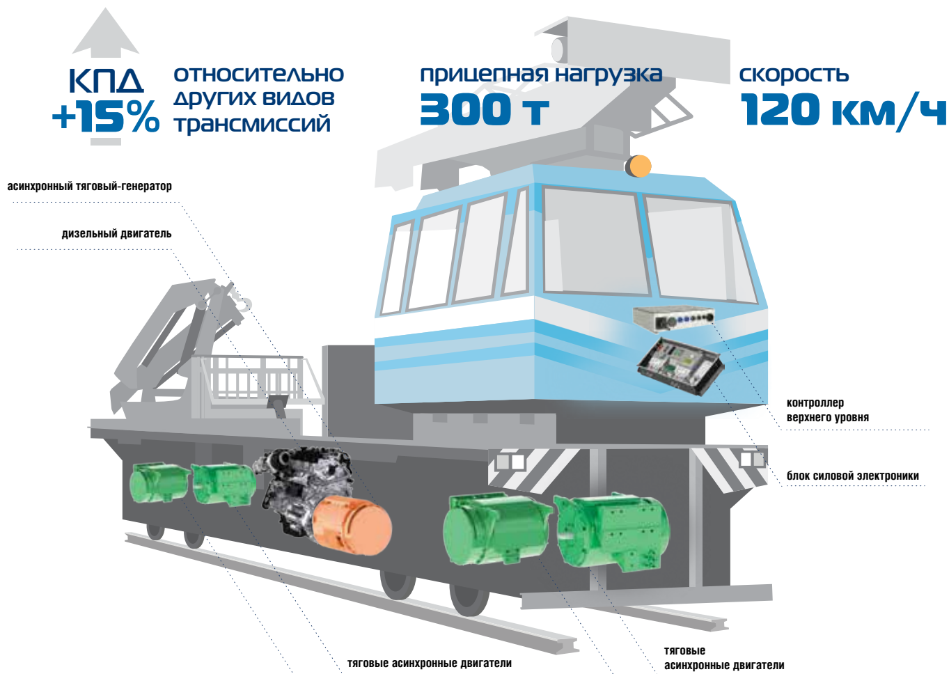
Компоненты асинхронного электрического привода